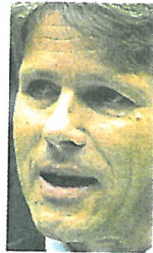
Staatssekretär Ostermayer will bis zum Jahr 2011 ein neues Volksgruppen-gesetz

Kanzler Faymann delegiert an Staatssekretär Ostermayer. KHD will Konsens aller Parteien.