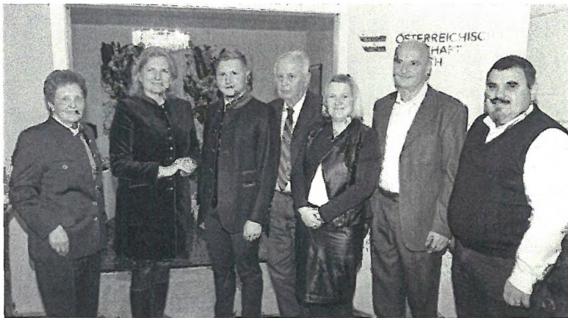
Treffen der Außenministerin Karin Kneissl mit Vertretern der deutschen Kulturvereine

In der RESOLUTION an die Republik Slowenien haben die Vorsitzenden der deutschsprachigen Kulturvereine als treue slowenische Staatsbürger in kultureller Verbundenheit mit dem slowenischen Staatsvolk bekundet, eine dauerhaft Friedensbrü-